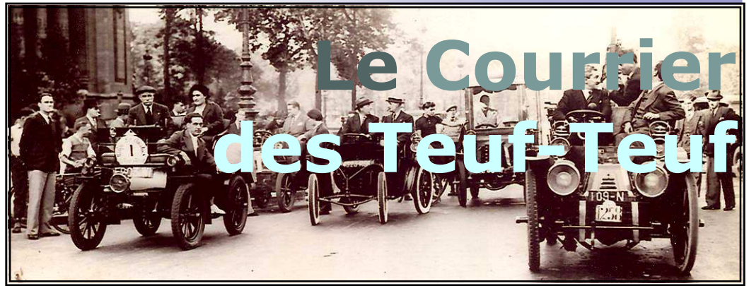
Les "TEUF-TEUF" 1ère Association Française des collectionneurs de Voitures Anciennes fondée en 1935