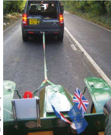
Toujours les mêmes qui se font tirer !

avez sûrement tous lus l'excellent article de H. Chaussin dans la LVA sur le sujet, alors juste un petit mot de plus de la part d'un des participants :